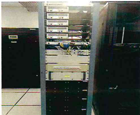
Rack de Comunicaciones-MRA

Con relación a este llamado se destaca que todos los Montajes, configuraciones y Capacitaciones fueron realizadas de acuerdo a lo establecido en el Contrato y las especificaciones Técnicas. Actualmente se encuentran Operativas y funcionando de manera Normal en las Instalaciones del Centro de Control Unificado de Mariano Roque Alonso y en la Torre de Control del Aeropuerto Internacional Silvio Pettitrossi.