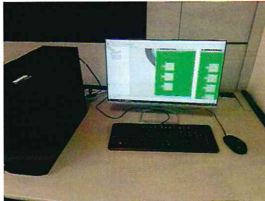
Sistema de Control y Monitoreo RCMS II