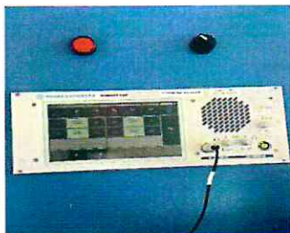
Consola AUX en TWR