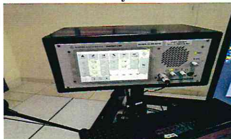
Consola AUX en ACC/APP